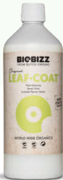
*Also available with spray